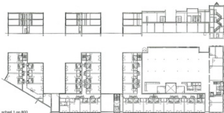
schaal 1 op 800