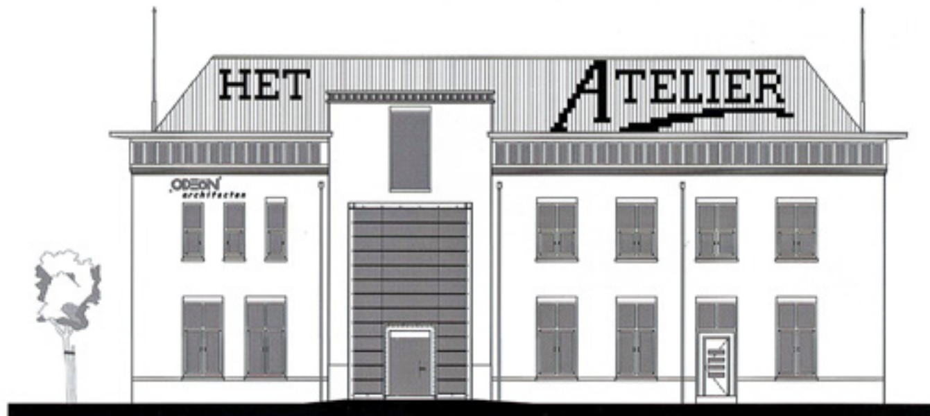
schaal 1 op 200